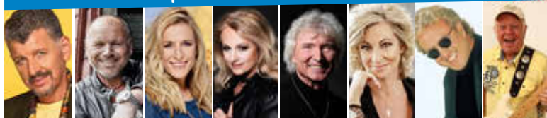
Semino Rossi, Olaf Henning, Stefanie Hertel, Nicole, Peter Orloff, Claudia Jung, Bernie Paul und Graham Bonney

Weitere Infos unter: www.schlager-kanaren.de