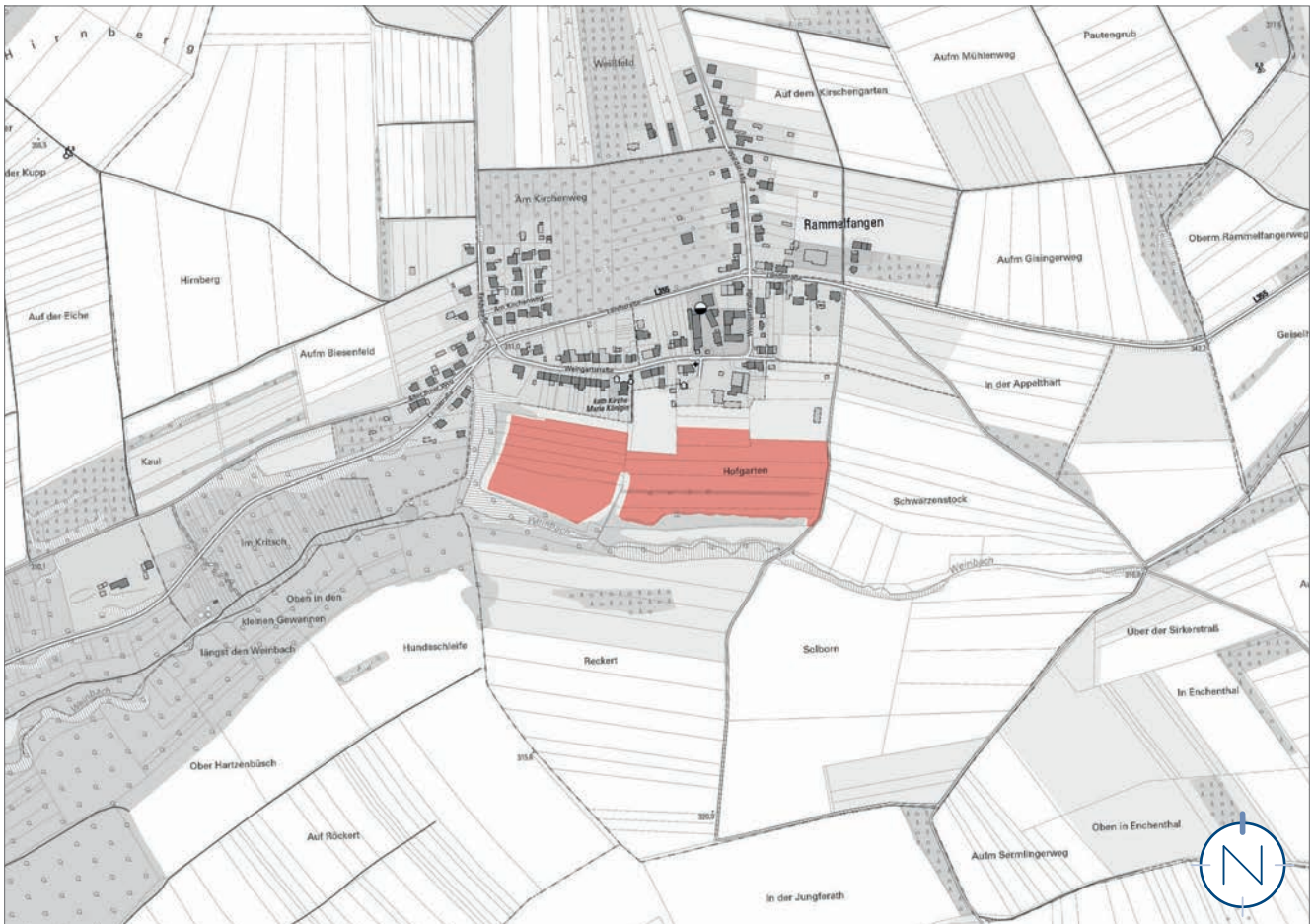
Lage des Plangebietes; ohne Maßstab; Quelle: LVGL, ZORA; Bearbeitung: Kernplan

Im Saarland dürfen bei Zuschlagsverfahren für Solaranlagen von der Bundesnetzagentur gemäß § 37c Absatz 1 des Erneuerbare-Energien-Gesetzes auch Gebote für Freiflächenanlagen auf Flächen nach § 37 Absatz 1 Nummer 3 Buchstaben h und i des Erneuerbare-Energien-Gesetzes nach Maßgabe von Absatz 2 im jeweiligen Umfang ihres Gebots bezuschlagt werden, die in der Potenzialkarte „Freiflächenpotenzial für Solaranlagen auf landwirtschaftlich genutzten Flächen in benachteiligten Gebieten im Saarland“ ausgewiesen sind.