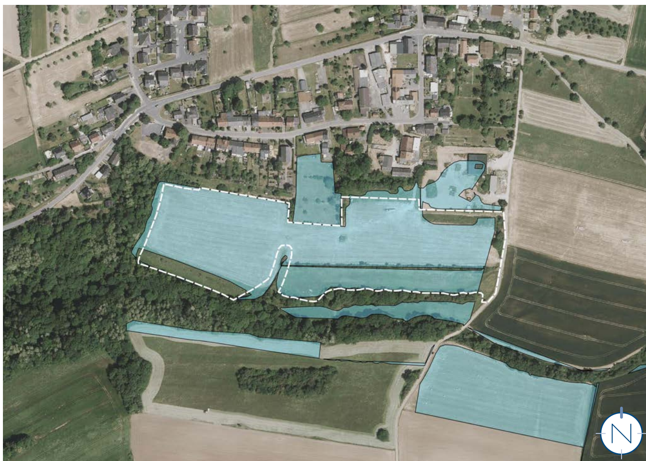
Orthophoto mit Lage des Plangebietes (weiße Balkenlinie), Freiflächenpotenzial für Solaranlagen auf landwirtschaftlich genutzten Flächen in benachteiligten Gebieten (blaue Flächen); ohne Maßstab; Quelle: LVGL, ZORA; Bearbeitung: Kernplan

Parallel zur Teiländerung des Flächennutzungsplanes ist eine Umweltprüfung nach § 2 Abs. 4 BauGB durchzuführen. Der Umweltbericht ist gesonderter Bestandteil der Begründung.