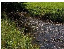
Ruwerbachlauf im Naturpark

Informationen zum Naturpark: Naturpark-Geschäftsstelle in Hermeskeil, Tel. 06503/9214-0, www.naturpark.org und @naturparksaarhunsrueck