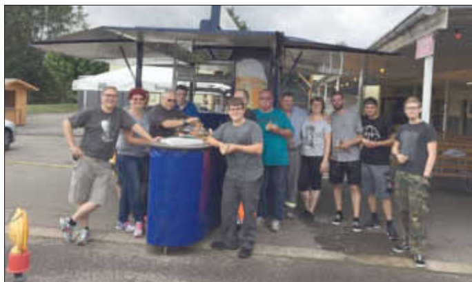
Das Aufbau - Team

Es waren zwei sehr schöne Kirmestage und wir hatten viel Spaß dabei. Bei allen, die mitgeholfen und dazu beigetragen haben die Kirmes zu gestalten, bedanken wir uns ganz herzlich.