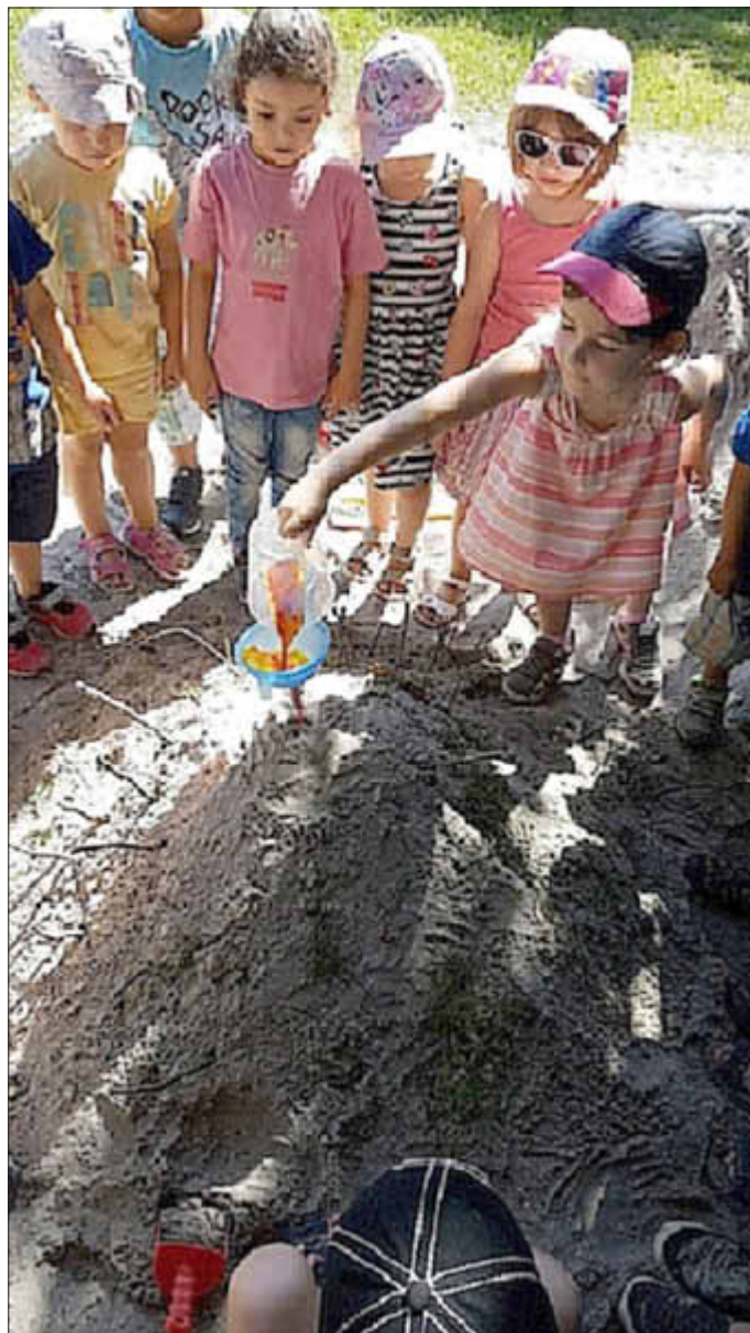
Die Spannung steigt...!

Besonders beliebt sind Experimente, denn hier kann das Kind Vorgänge mit verfolgen und nachvollziehen und erlebt stets einen „Aha-Effekt“, selbst wenn es vorher schon das Ergebnis kennt.