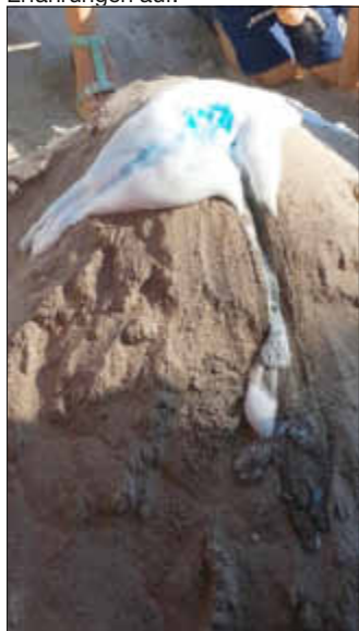
Vulkanausbruch Nr. 1

Am spannendsten ist es aber, wenn sie das Ergebnis noch nicht vorher kennen und so der Überraschungseffekt um so größer ist. Vor allem aber verfolgen sie jeden einzelnen Schritt mit Spannung und großem Interesse und nehmen auf diese Weise viele Informationen und neue Erfahrungen auf.