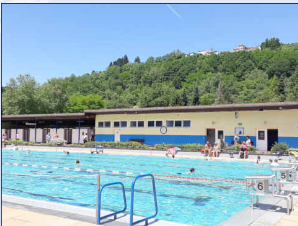
Das beheizte Becken lädt bei jedem Wetter zum Schwimmen ein