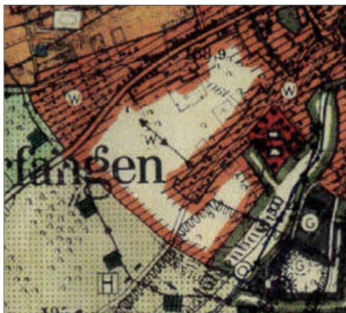
Abbildung: Geltungsbereich Plangebiet

Die genaue Abgrenzung des Geltungsbereiches ist der folgenden Abbildung zu entnehmen.