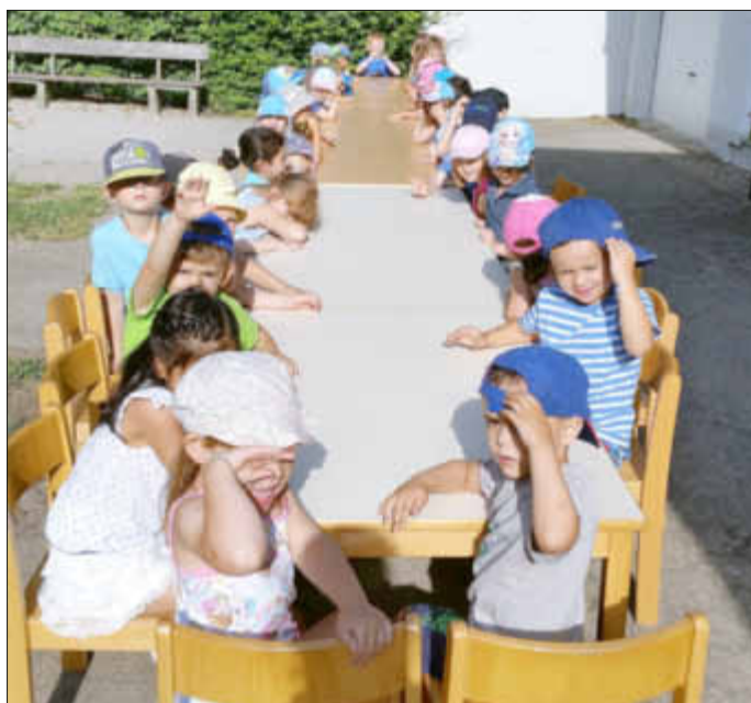
Eine sehr große Tafel...

Noch vor Beginn der Schul-Sommerferien luden wir alle Kinder zur Abschiedsfeier für die und von den diesjährigen Schulkindern ein.