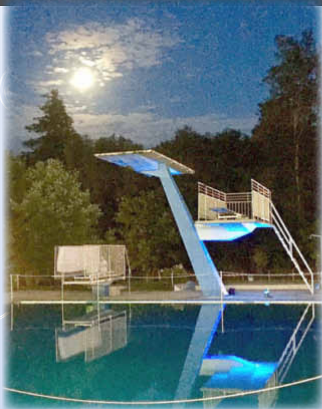
Vollmond am Pool

Das Wallerfanger Freibad bietet nicht nur während des täglichen Schwimmbetriebs Gelegenheit, sich zu entspannen, sich sportlich zu betätigen und sich zu vergnügen.