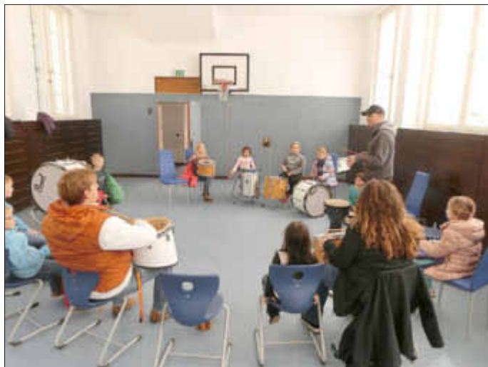
Nach dem 3-tägigen Workshop wird die neue Trommelgruppe bis zum Uniceflauf weiter üben, um in „Form“ zu bleiben

Wallerfangen, Cafeteria der Fachklinik für Psychiatrie Vorverkauf: 12,00 €, Abendkasse: 14,00 €