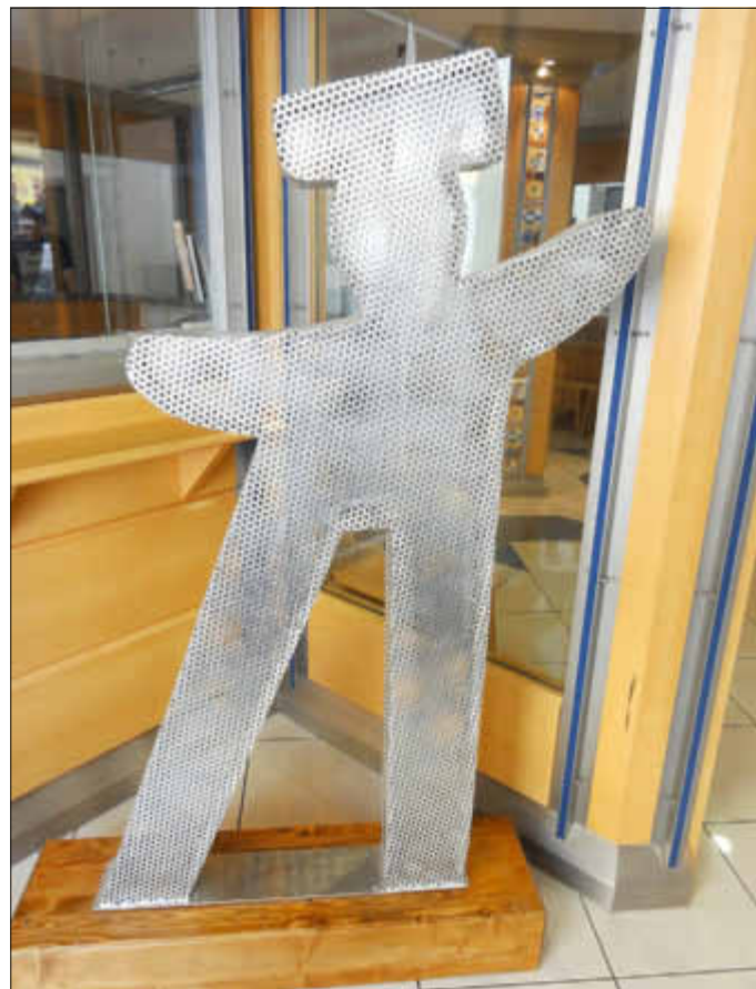
Fördinand: stilisierter Förderturm mit Doktorhut als Symbol für Strukturwandel

Vor diesem Hintergrund wurde das Programm „Studienpioniere“ – Erhöhung der Studierneigung von Studierberechtigten aus Nichtakademikerfamilien“ konzipiert. Es wird durch das Ministerium für Wirtschaft, Arbeit, Energie und Verkehr und den Europäischen Sozialfonds gefördert. FutureCoaching ist eine Maßnahme aus ebendiesem Programm.