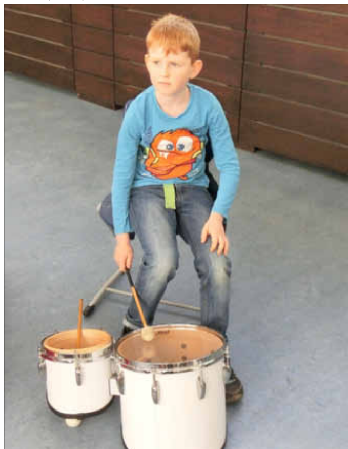
Nicht groß, dafür aber 2 auf einen Streich