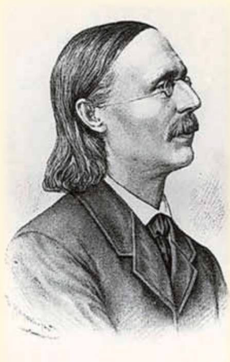
Der Dichterkomponist Peter Cornelius (1824-74)

Wo: Katholisches Pfarr- und Jugendheim Wallerfangen, Villeroy-Str. 7