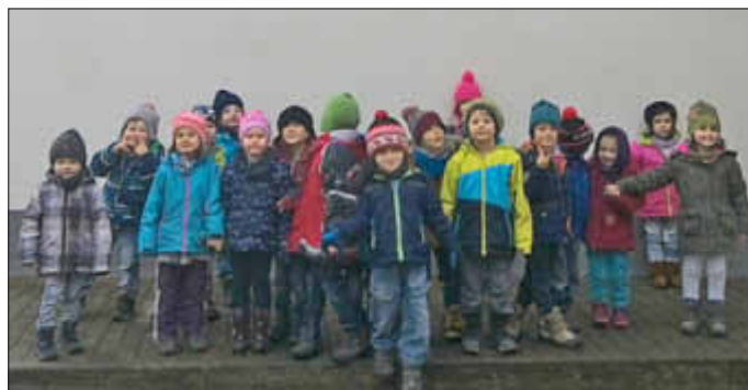
Die Kinder und Erzieherinnen der Kita Ittersdorf

Wir alle danken unserer Feuerwehr für ihre Freundlichkeit und zu Gewandtheit!