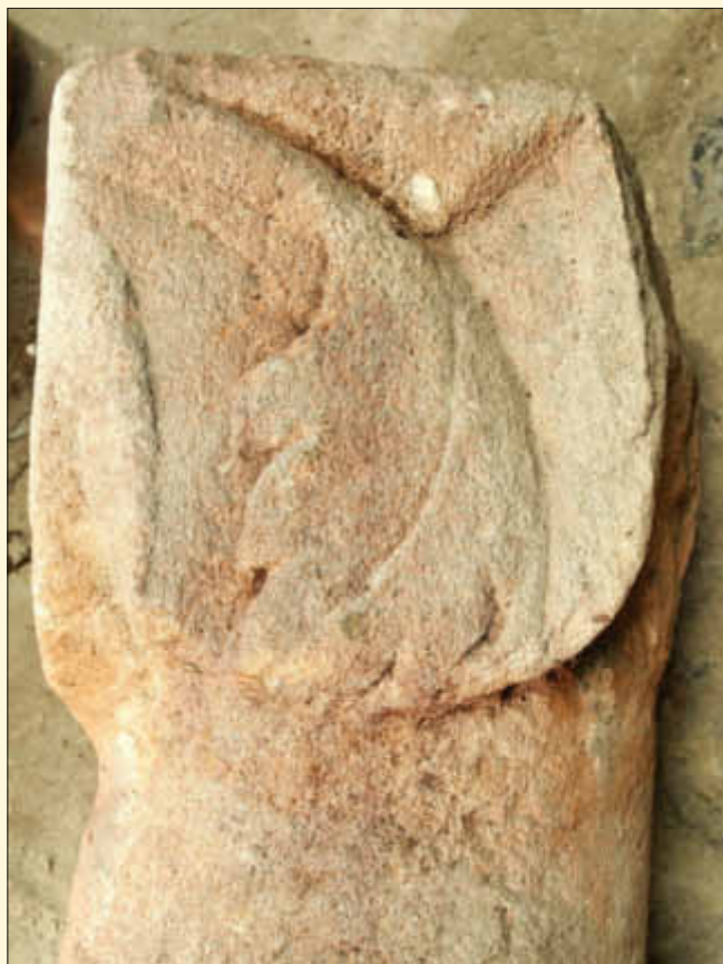
Fränkisches Säulenteil mit römischem Blattornament

Bevor wir uns zwei Ausstellungsstücken im neuen Museum am Adolphsplatz widmen, richten wir unser Auge auf einen der Höhenzüge, die Wallerfangen umgeben. Hier, auf der Humburg, stand einst eine ungewöhnliche Befestigungsanlage, eine Turmhügelburg aus dem ganz frühen Mittelalter. Der so bezeichnete Typus entstand in Mittel- bis Osteuropa im 9. und 10. Jh. und kennzeichnet die Zeit vor den dynastischen Ritterburgen. Meist handelte es sich bei der Turmhügelburg um den ständigen Wohnsitz eines Angehörigen des niederen Adels und seiner Familie. Die Suche nach dem kulturellen Erbe eines Ortes ist oft eine beschwerliche Reise durch Raum und Zeit. Wallerfangens geschichtliche Überlieferung beginnt mit einer solchen hölzernen Turmhügelburg, die im 10. Jh. aus Stein errichtet wurde. Es sind zwei Urkunden, die Graf Egilof im Jahr 962 n. Chr. und Graf Giselbert im Jahr 996 n. Chr. als