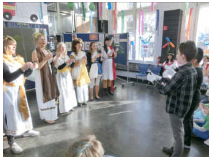
Die Verlierer der Gladiatorinnenkämpfe mussten sich ihr Leben durch harte Strafen verdienen