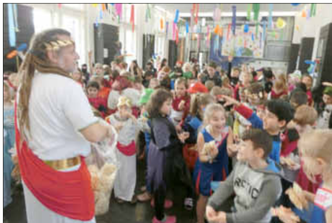
Das Volk wurde durch das Auswerfen von über 1000 Süßigkeitenteilen gut gelaunt auf die Fastnachtsferien eingestimmt.