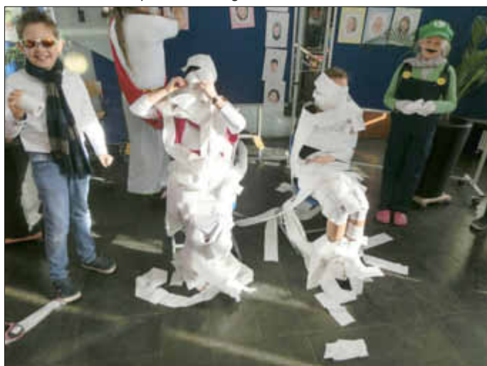
Die Gladiatorinnen mussten sich in harten Battles beweisen