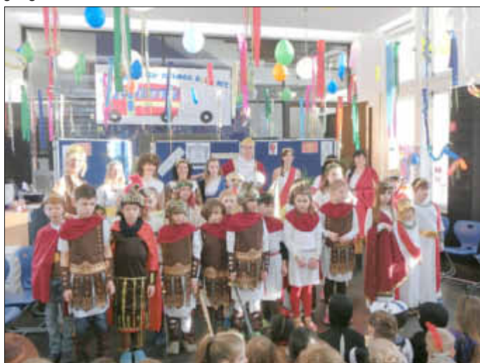
Cäsar mit seinem imposanten Aufgebot