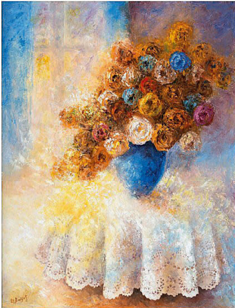
Roses sur dentelle, 90 x 75 cm