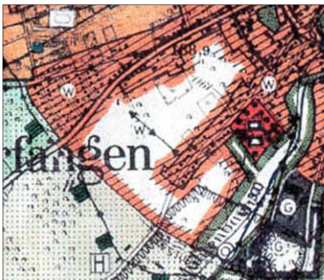
Abbildung: Geltungsbereich Plangebiet

Die genaue Abgrenzung des Geltungsbereiches ist der folgenden Abbildung zu entnehmen.