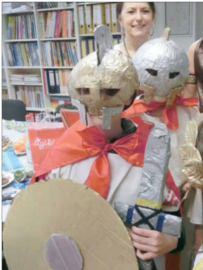
Den schwerbewaffneten Soldaten wurde kein großer Widerstand entgegengebracht