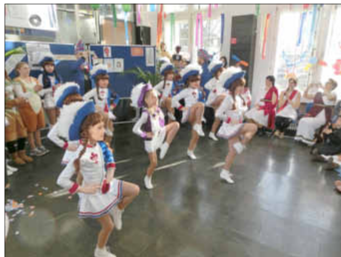
Die Garde der Faasendrebellen