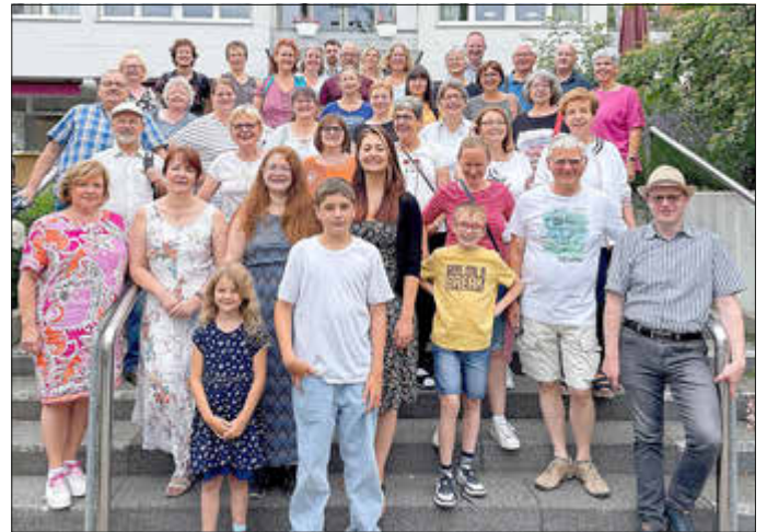
Unser Besuch in Kornelimünster

Wir freuen uns über alle interessierten Zuhörerinnen und Zuhörer!