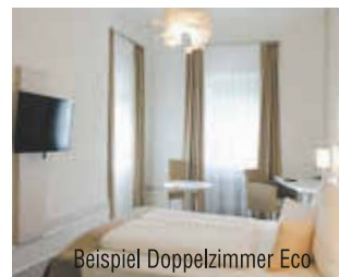
Beispiel Doppelzimmer Eco