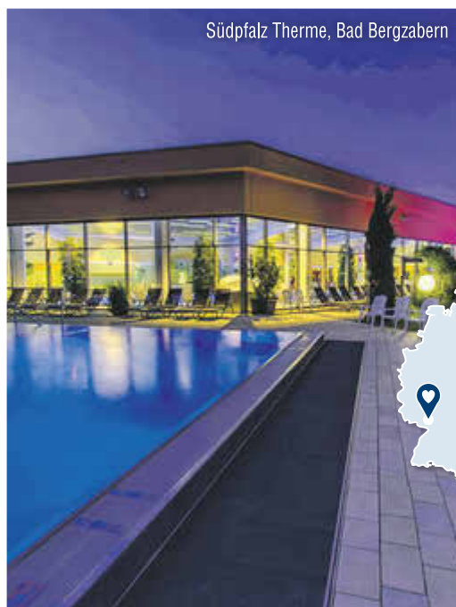
Südpfalz Therme, Bad Bergzabern