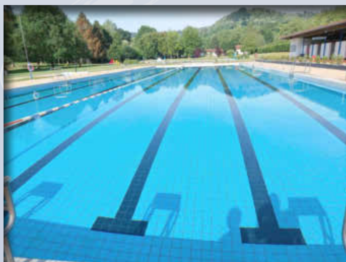
Das lädt zum Schwimmen ein!

Schwimmen ist ein idealer Ganzkörpersport. Fast die komplette Muskulatur ist beim Schwimmen im Einsatz. Die Belastung für den Körper ist dabei äußerst gering, sodass das Schwimmen ausgesprochen gelenkschonend ist.