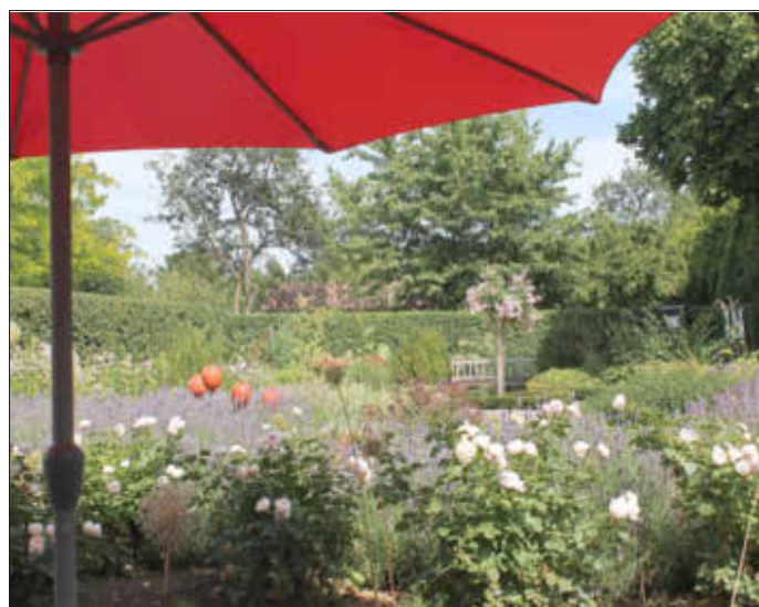
Der Garten des lothringischen Bauernhauses Haus Saargau in Gisingen