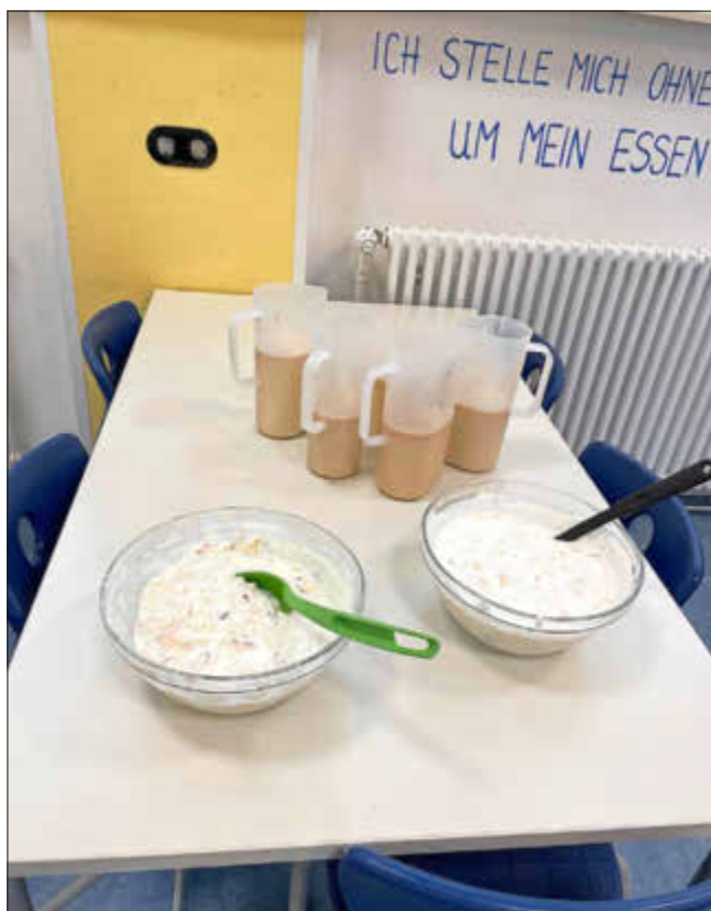
Milchmix und Früchtequark als Nachtisch