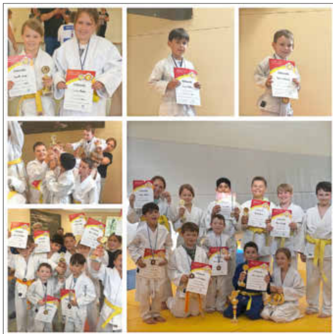
Wir waren mit 9 Kindern auf einem schönen Turnier, bei dem nicht nur für jeden eine tolle Platzierung als Ergebnis feststand, sondern auch einen 3. Platz für die Mannschaftsplatzierung.