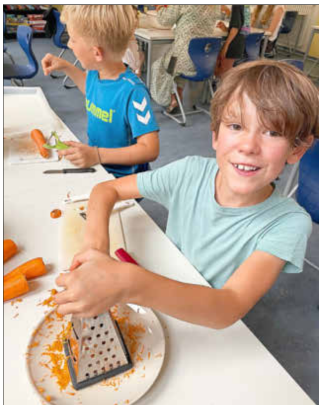
Das Raspeln von Möhren macht großen Spaß