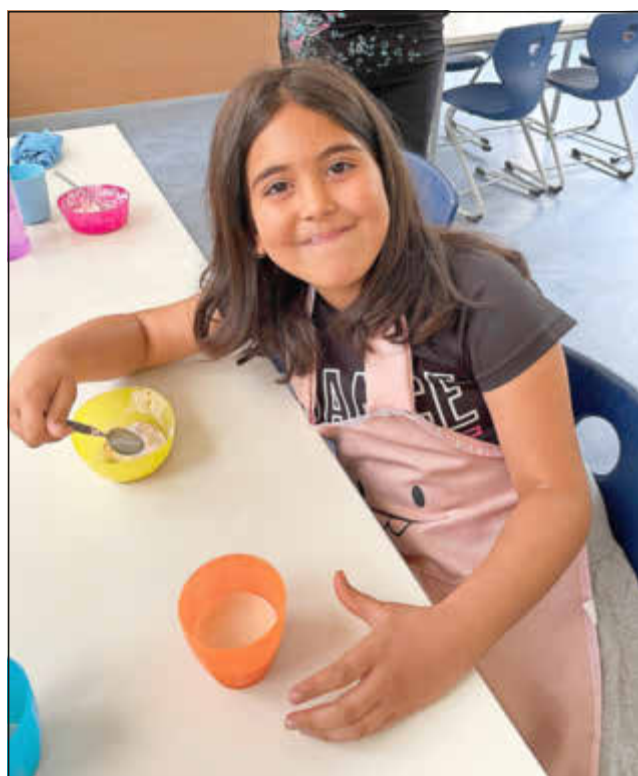
Der Quark hat offensichtlich gut geschmeckt