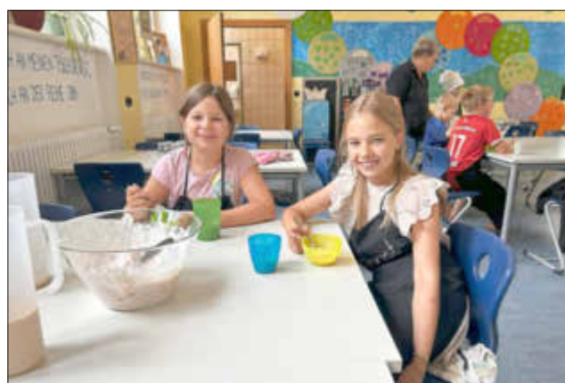
Fröhliche Gesichter beim Essen