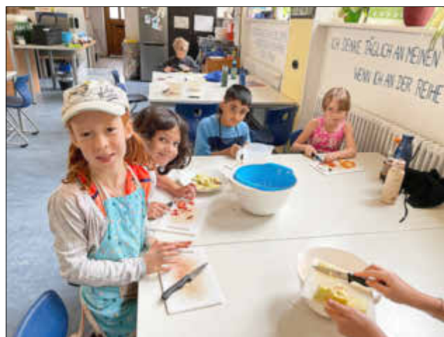
Eifrig beim Vorbereiten der Früchte