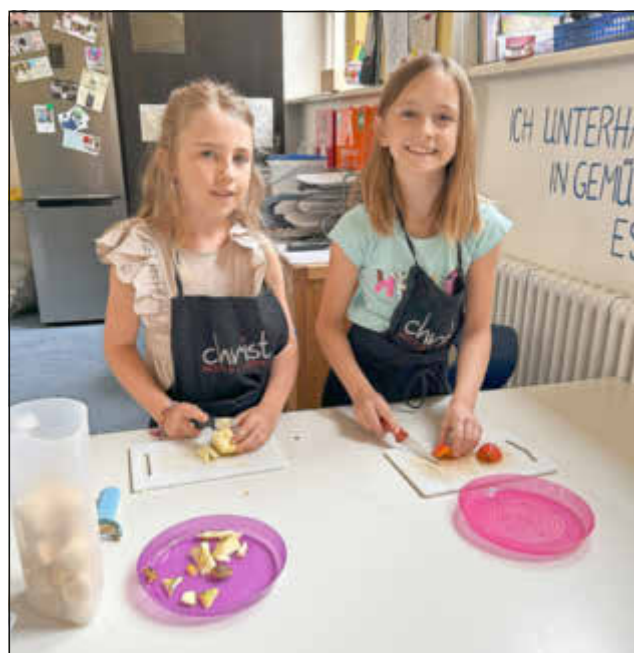
Sorgfältige Vorbereitung der Früchte