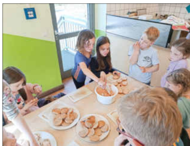
Brötchenaufstrich im Teamwork