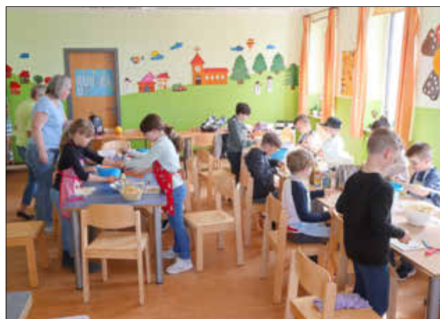
Alle arbeiten mit Feuereifer