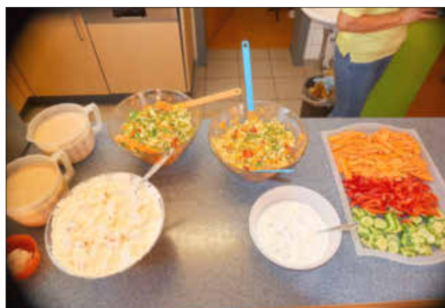
Ein Teil des Buffets