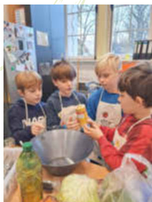
Gemeinsames Abmessen der Zutaten