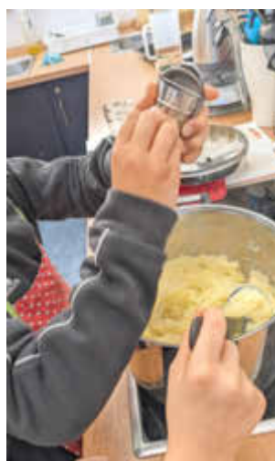
Frisch geriebene Muskatnuß für das Kartoffelpüree