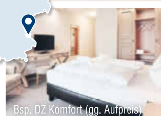
Bsp. DZ Komfort (gg. Aufpreis)