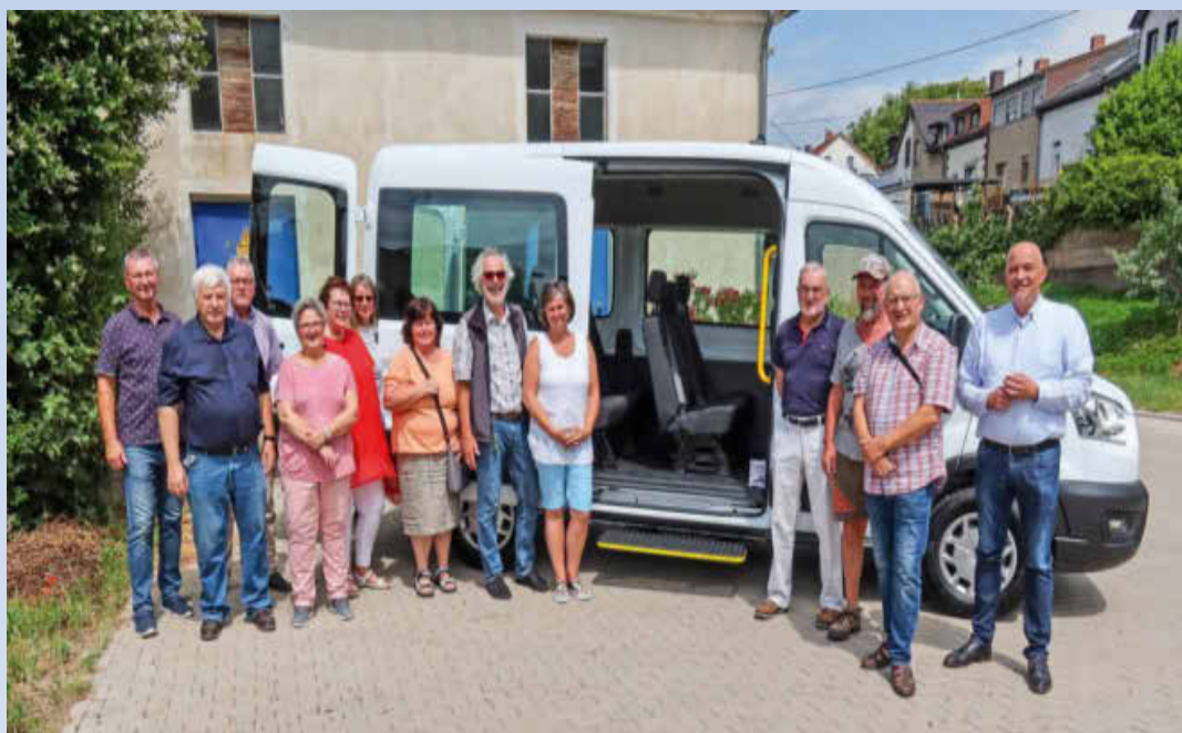
Der Bus mit seinen ehrenamtlichen Fahrern und Helfern.

Weitere Informationen: finden Sie auf der Homepage der Gemeinde Wallerfangen: www.wallerfangen.de/Leben/Buergerbus und immer wieder im Amtsblatt.