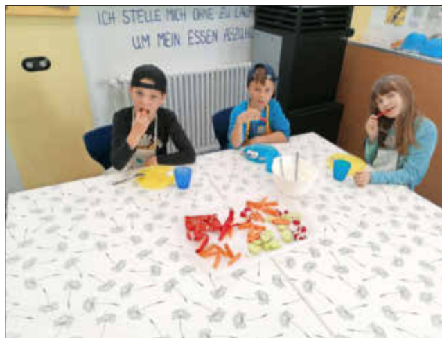
Es schmeckt, wie man sieht