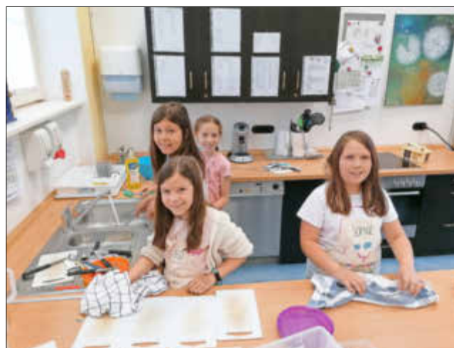
Auch das Spülen und Abtrocknen macht Spaß