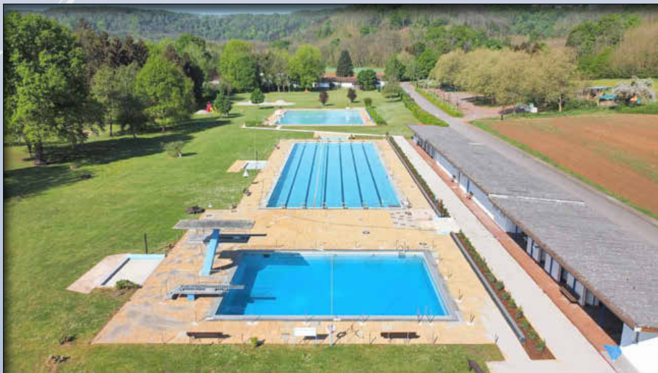
Aus der Luft besonders gut zu erkennen: die idyllische Lage unseres Freibads

Freibad Wallerfangen...mehr als schwimmen