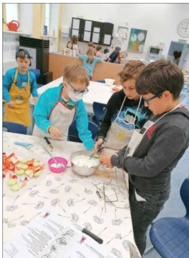
Der Schnittlauch wird mit der Schere in den Quark geschnitten