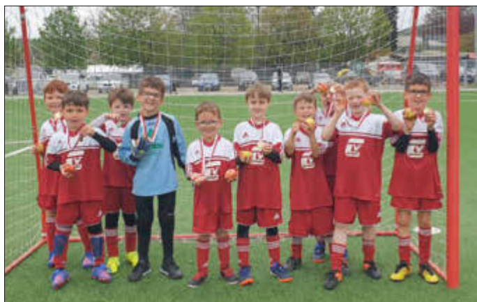
Geschafft! Das stolze Team nach dem 1. Turnier!