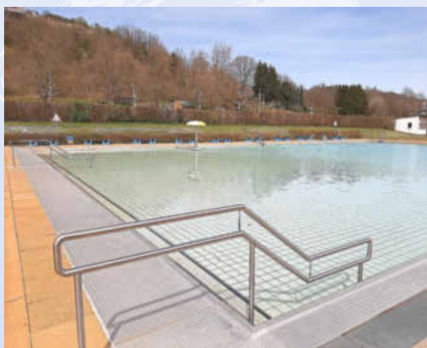
Der neue Handlauf am Mehrzweckbecken

Der Wettergott bescherte uns in diesem Jahr bereits einige sonnige Frühlingstage, teilweise mit recht hohen Temperaturen, Die Freibadfans warten wie jedes Jahr schon ganz ungeduldig auf den Saisonstart.