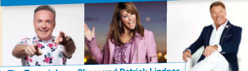
Tim Toupet, Ireen Sheer und Patrick Lindner