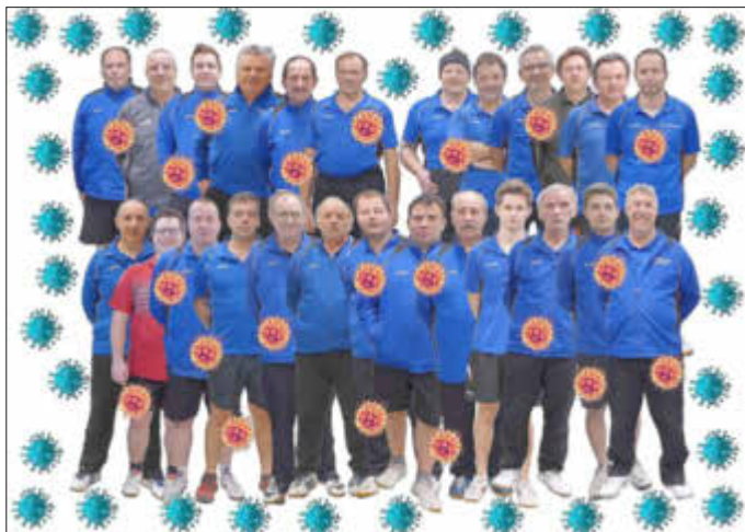
Der Corona-Virus bestimmt den Terminplan des TTC Wallerfangen

Mehr über den Verein und seinen Aktivitäten erfahren Sie unter: www.ttc-wallerfangen.de