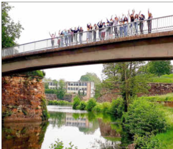
Das SGS liegt mitten in der Natur.

Schülerinnen und Schüler der 6. Klassenstufe des SGS gingen auf Exkursion mit dem Fledermausdetektor und erlebten die Echoorientierung der Fledermäuse live am Saar-Altarm.