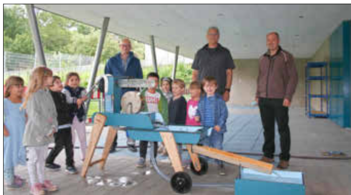
Vorstandsmitglieder des Fördervereins mit der Kita-Leitung

Nach der großen Menge an Wasser, die in der letzten Zeit von oben kam, kann nun auch der Kindergarten St. Katharina in Wallerfangen sagen: „Wasser marsch!“.