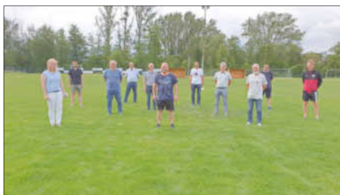
Der neue Vorstand des VfB Gisingen

Wir danken den ausgeschiedenen Vorstandsmitgliedern für ihr Engagement für den VfB Gisingen und für die Bereitschaft den Verein auch weiterhin zu unterstützen.