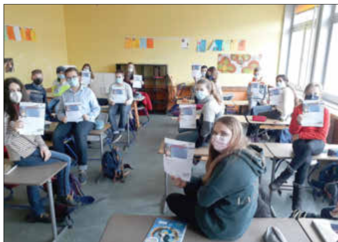
Die Klasse 6L2 freut sich über ihre Auszeichnungen.