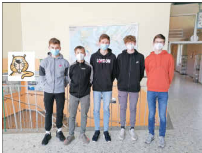
Die Preisträger der Klassenstufe 8 des SGS