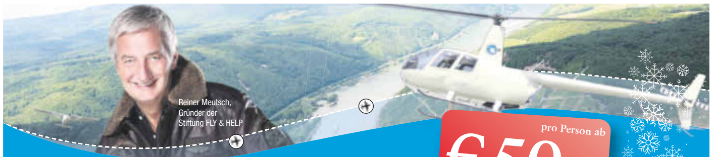
Reiner Meusch, Gründer der Stiftung FLY & HELP

energis-Netzgesellschaft mbH • Heinrich-Böcking-Straße 10–14 • 66121 Saarbrücken