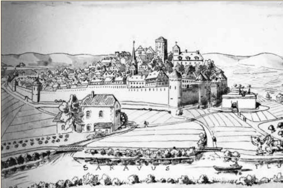
Festungsstadt Vaudrevange (Wallerfangen)

Es ist nicht überliefert, wo genau im Jahre 1683 der König von Frankreich anlässlich der Verleihung des Stadtwappens von Saarlouis in Vaudrevange (Wallerfangen) übernachtet hat.