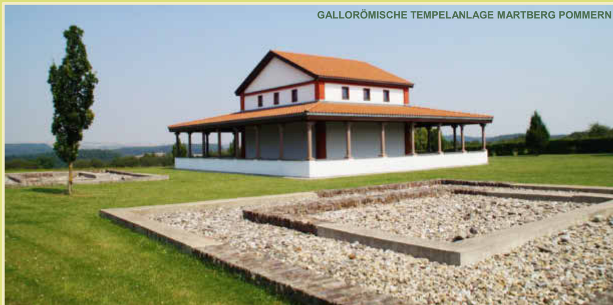
GALLORÖMISCHE TEMPELANLAGE MARTBERG POMMERN