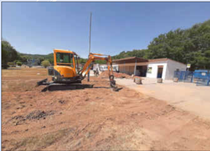
Erdarbeiten im Eingangsbereich

Freibad Wallerfangen... mehr als schwimmen www.freibadwallerfangen.de