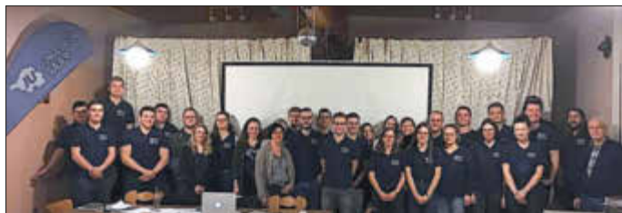
Die Junge Union Gisingen 2019

Der Jahreswechsel ist traditionell eine Zeit der Vorsätze und bekanntermaßen stehen wir, die aktive Gauer Jugend, nicht still. Vieles kommt auch 2020 auf uns zu, angefangen mit dem CDU-Neujahrsempfang am kommenden Samstag. Kurz darauf folgt auch unsere diesjährige Jahreshauptversammlung mit Neuwahlen, zu der zu gegebener Zeit noch eingeladen wird. Wie alle zwei Jahre werden wir wieder eine grandiose mehrtägige Vereinsfahrt zur Stärkung des Zusammenhalts und der Gemeinschaft veranstalten. Diesmal gehts in die Hansestadt Hamburg!