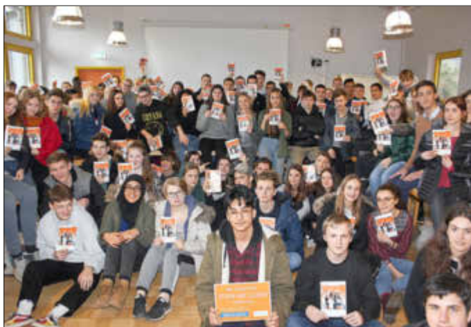
Schüler des Stadtgartengymnasiums beim Projekt „Stark ins Leben“

„Fit für die Oberstufe“, „Stark ins Leben“ und Berufsorientierung