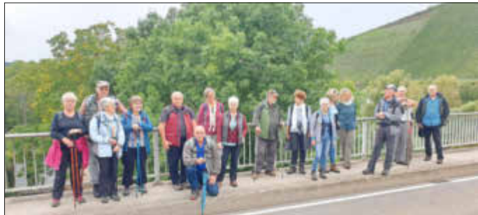
Wanderung Wiltiger Saarbogen