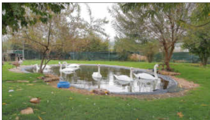
Gehege mit Jungschwänen, die auf ihre Reise auf die Alster in Hamburg warten