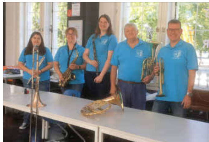
das Team beim Workshop in der Grundschule

Insgesamt hat es uns und den vielen Kindern jede Menge Spaß gemacht und es wäre für uns der schönste Lohn, wenn wir dabei Interesse für ein Instrument geweckt hätten und Eltern diesbezüglich auf den Verein zu kämen.