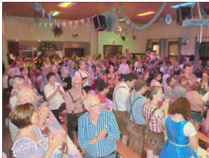
Zum 8. Mal findet das Oktoberfest in Kerlingen statt.