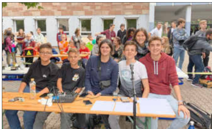
Das Foto zeigt das erfolgreiche Organisationsteam der Schülervvertretung des SGS sowie ein Spiel der Mittelstufe