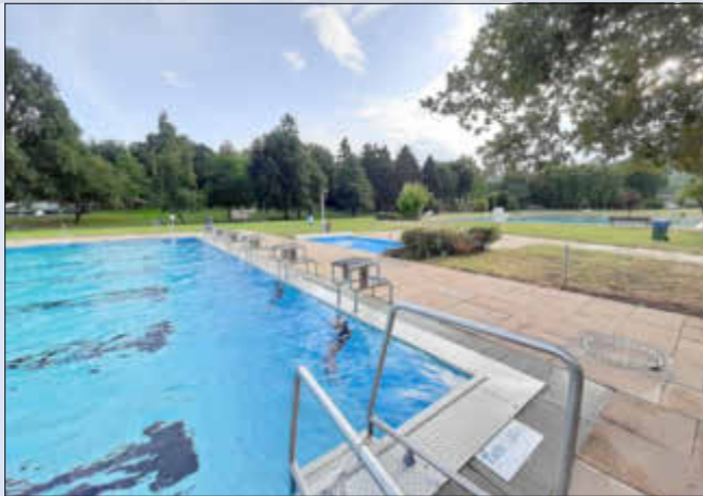
Leider bis zum Frühjahr 2020 geschlossen

Die Freibadsaison 2019 ist leider zu Ende, sehr zum Leidwesen aller Schwimmbesucher und Freibadfans.