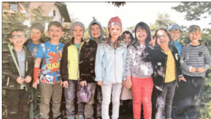
Unsere Abschlusskinder 2019

Für die meisten der Kinder geht eine dreijährige Kindergartenzeit zu Ende und wir sehen die tollen Erfolge und große Entwicklung jedes einzelnen Kindes, seitdem es zu uns gekommen war.