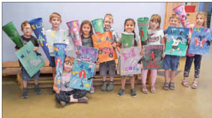
Die Kinder haben ihre Schultüte mit Wunschkarte selbst gestaltet und die passende Sammelmappe gab es von uns als Geschenk dazu

Deshalb fällt es uns auch nicht ganz so leicht von jedem Kind und seinen Eltern Abschied zu nehmen. Da wir uns aber auch freuen, dass nun eine neue Herausforderung auf die Kinder wartet, sagen wir mit einem lachenden und einem weinenden Auge tschüs und auf Wiedersehen.