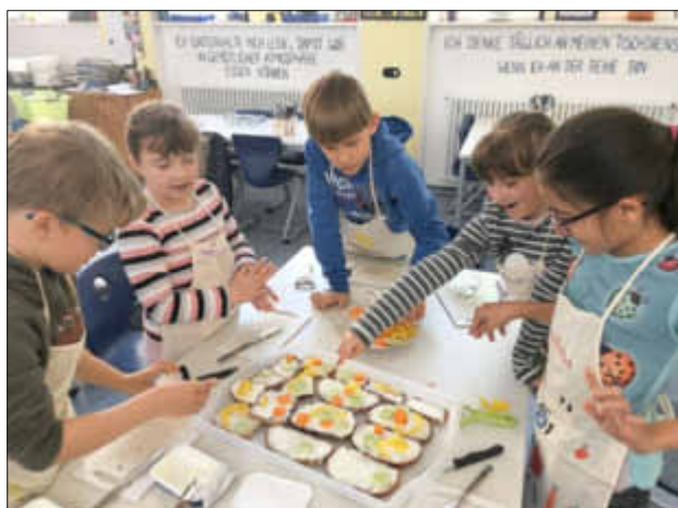
Mit Eifer bei der Sache