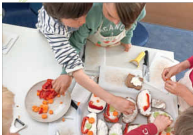
Eifrig beim Verzieren der Brotgesichter