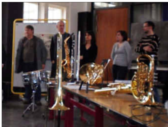
Erinnerung an die Instrumentenausstellung 2010

Sollten Sie Interesse am Erlernen eines Instrumentes haben, können Sie hier die dazu nötigen Informationen bekommen und sich Ihre Fragen beantworten lassen. Auch ein Wiedereinstieg nach vielen Jahren Pause ist immer möglich!