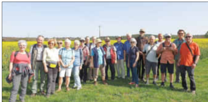
Ostermontag der Franziskusweg

Heute bieten mehrere selbstvermarktende Winzer ihre edlen Weine und Winzersekte an. Den rund 1.650 Einwohnern ist es gelungen, das traditionelle Dorfbild zu erhalten und ältere, prägende Häuser zu restaurieren.