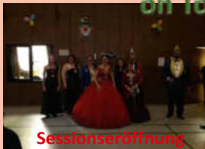
Sessionseröffnung Pähter Dickkäpp 17.11.2018