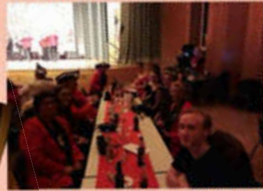
Sessionseröffnung KG Fraulautern 10.11.2018