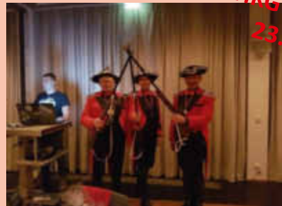
Sessionseröffnung HKG Heusweiler 23.11.2018