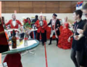
Sessionseröffnung KV Grad ze laes's Beckingen 04.11.2018