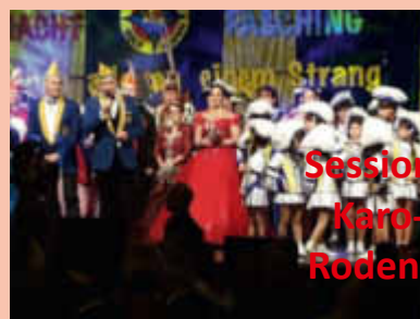
Sessionseröffnung Karo-Blau-Gold Roden 11.11.2018