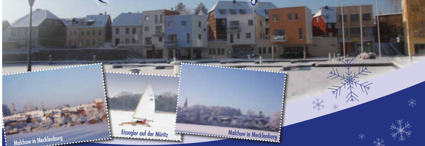
Malchow in Mecklenburg