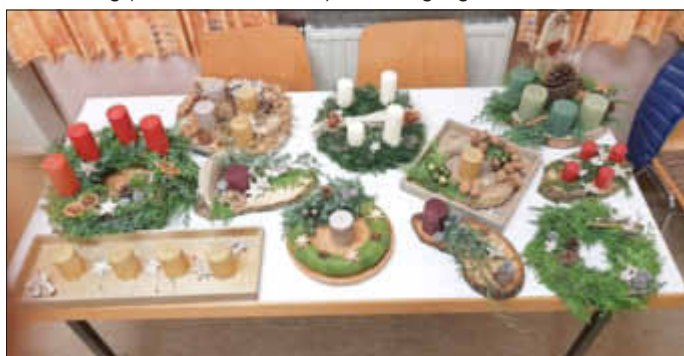
Das gelungene Ergebnis des vergangenen Treffens

Anmeldung ist erwünscht. Für Rückfragen und Anmeldung steht Silvia Hemmerling (Tel.:06837/ 4440110) zur Verfügung.