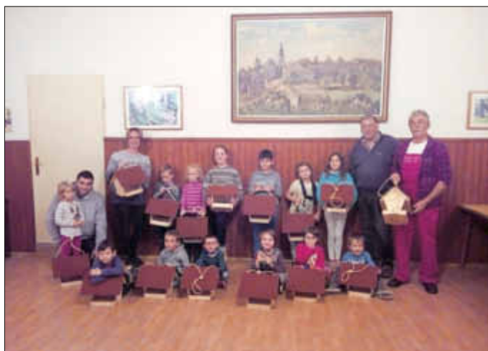
16 Kinder hämmerten und schraubten wunderschöne Futterhäuschen im Leidinger Dorfgemeinschaftshaus zusammen.