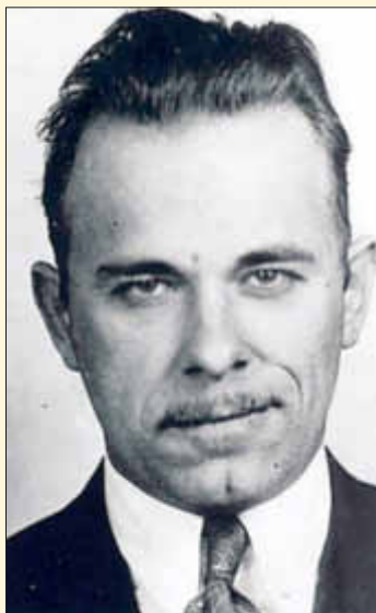
John Herbert Dillinger, der weltberühmte Enkel eines Leinenwebers aus Gisingen

In den USA waren Figuren wie „Bonnie and Clyde“, „Ma Baker“ oder „John Dillinger“ Protagonisten der „Staatsfeind-Ära“ und schon zu Lebzeiten gefeierte Helden. Wenn man diese Tatsachen verfolgt, spürt man die amerikanische Faszination für die Poesie des Verbrechens, aus der so viele große Filme entstanden sind. John Dillinger (1903-34) zog mit seinen legendären Straftaten, die er in einer Zeitspanne von nur 13 Monaten zwischen 1933 und 1934 beging, die Aufmerksamkeit des ganzen Landes und von Teilen der alten Welt auf sich.