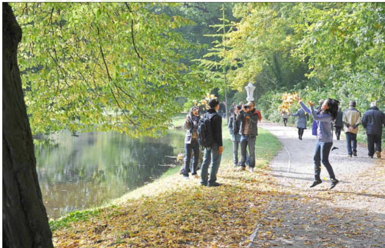
Besonders gut für das Immunsystem: Bewegung an der frischen Luft

Unser Körper besitzt ein komplexes System zum Schutz vor Krankheitserregern und Fremdstoffen.