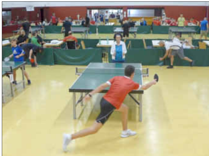
Regel Tischtennisbetrieb während des Turnier's