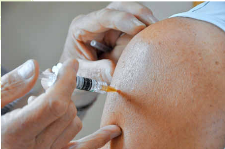
Impfungen werden im allgemeinen in den Oberarm gegeben

Die WHO und die deutsche Ständige Impfkommission (STIKO) empfehlen die jährliche