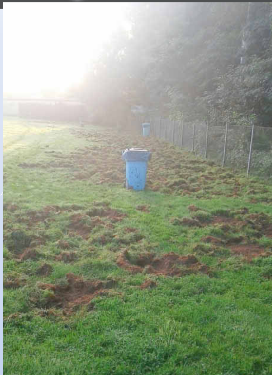
Wildschweinschaden im Freibad

Bereits zum 2. Mal in diesem Jahr bekam unser Freibad nächtlichen ungebetenen Besuch von Wildschweinen. Die Tiere haben den Zaun zwischen Technikgebäude und Planschbecken durchbrochen und Teile der Liegewiese durchwühlt.