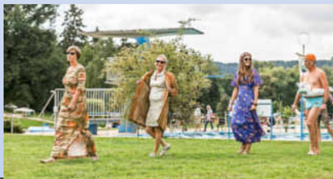
Modenschau beim Sommerfest

Dem gesamten Schwimmbad-Team wünschen wir gute Erholung von den Strapazen und freuen uns auf ein frohes Wiedersehen in der Saison 2019!