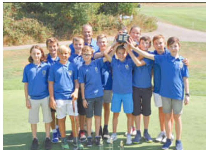
Gruppenfoto: Jugend-Team Golfclub in Gisingen - Saar-Trophy Sieger 2018