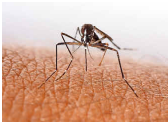
Besonderer Plagegeist - die Stechmücke

Gerade empfindliche Personen, deren Körpergeruch oder Parfum bei Insekten besonders gut ankommt, sollten sich vor Aufenthalt im Freien mit sogenannten „Repellentien“ (Autan o.ä.) einreiben. Und v.a. in der Zwetschenkuchenzeit sollte man unbedingt bei jedem Bissen drauf achten, dass sich kein Mitesser im Anflug befindet.