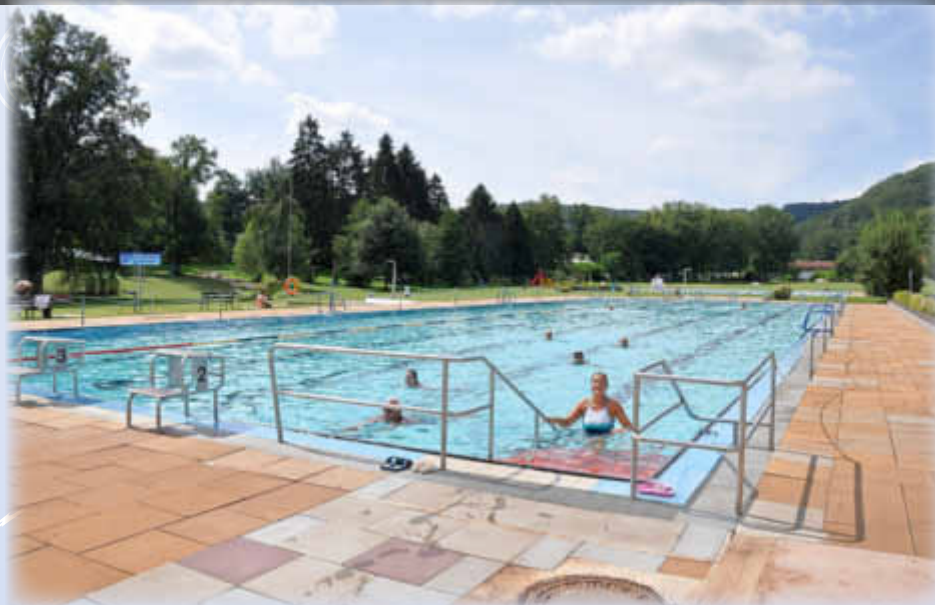
Bei den derzeitigen Hochsommer-Temperaturen tut das Schwimmen besonders gut!

Krampfadern und damit verbundene Beschwerden sind bei uns mittlerweile eine Volkskrankheit geworden.