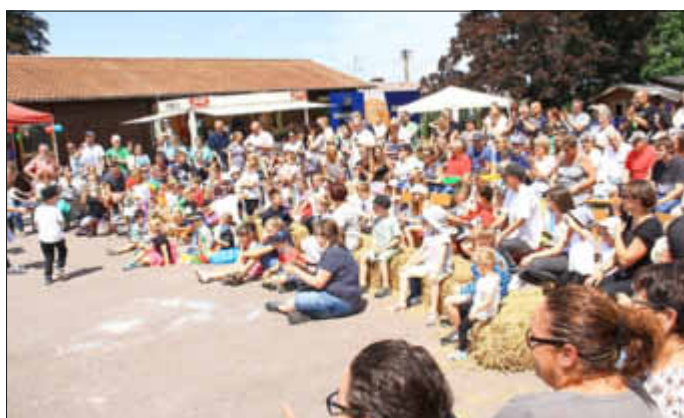
Die Zuschauer warteten in der Manege auf den Einzug der Artisten