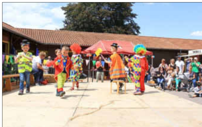
Die lustigen Clowns brachten das Publikum zum lachen