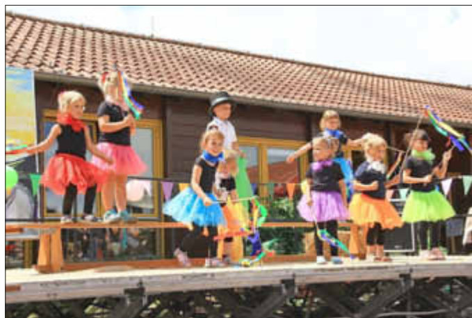
Die Seit tänzer während ihres Auftritts