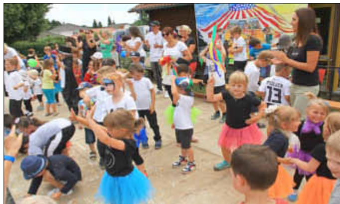
Zum Abschluss tanzten und feierten alle zusammen auf der Bühne