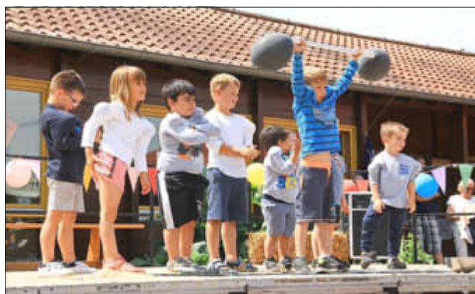
Die Gewichtheber zeigten ihre starken Muskeln

„Manege frei“ so hieß das Motto des diesjährigen Sommerfestes in der Kita in Ittersdorf. Hier einige Impressionen unserer Kinder auf der großen Bühne.