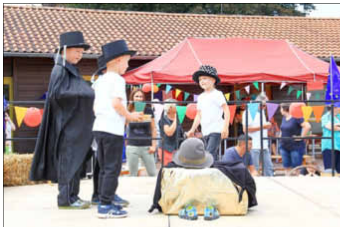
Die magische Zaubershow