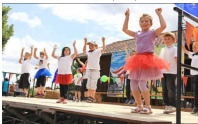
Die Vorschulinder begeisterten das Publikum mit ihrer Tanzaufführung