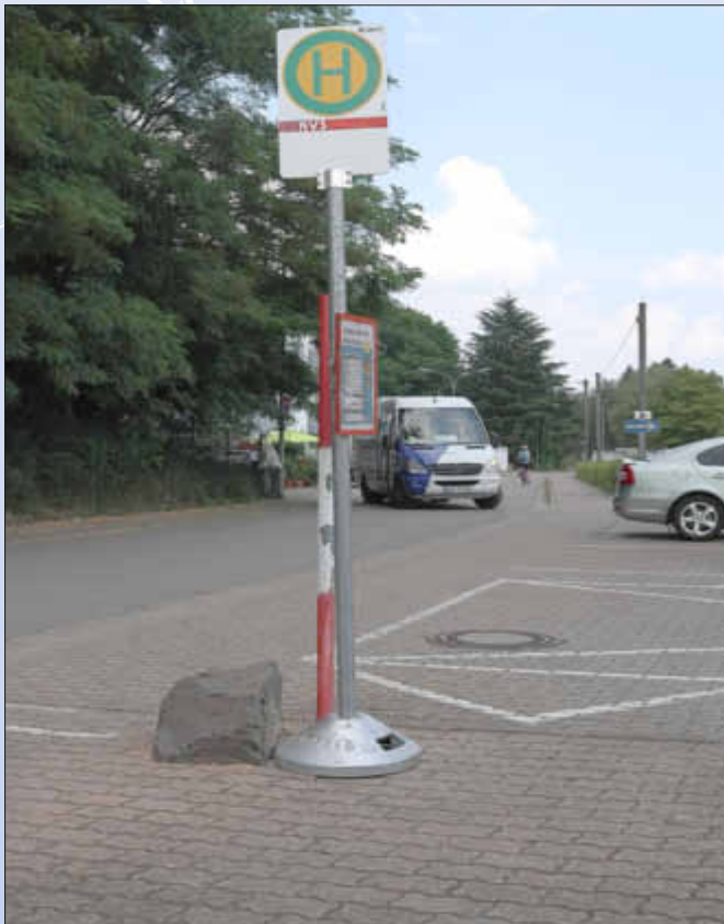
Die Schwimmbadbus-Haltestelle vor dem Freibad