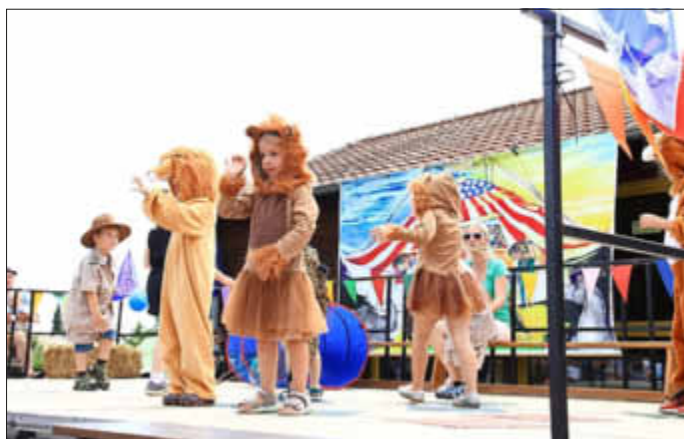
Die wilden Tiere wurden vom Dompteur gebändigt