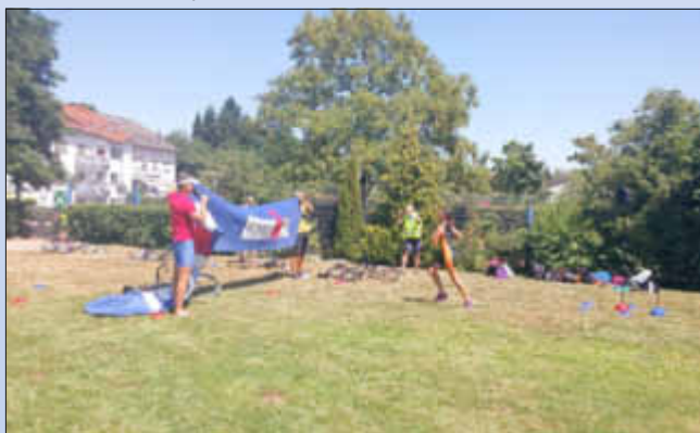
Jetzt hat auch Wallerfangen einen Ironman!