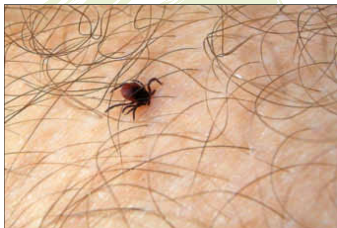
Der Übeltäter - die Zecke

Schon seit den ersten Frühlingstagen sind die Zecken aktiv. Bis in den Herbst hinein ist bei Aufenthalten im Freien mit Zeckenstichen zu rechnen.