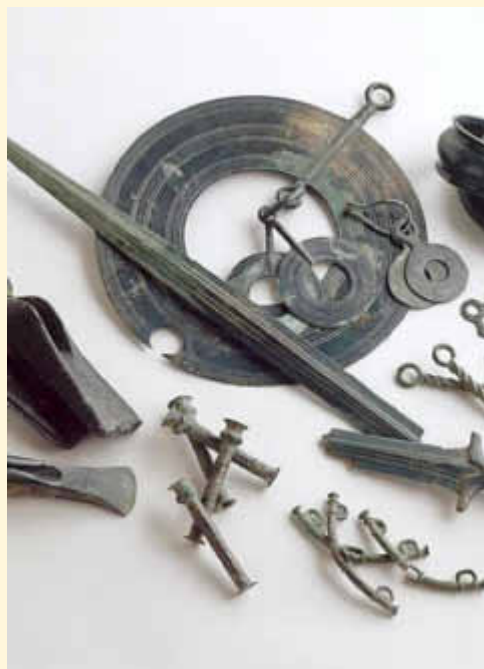
Originale Teile des Wallerfanger Hortfundes

Erze, aus denen Kupfer geschmolzen werden konnte, wurden im Bereich des Limbergs mit Bestimmtheit schon in der späteren Bronzezeit gewonnen. Als Beweise sind die aus dieser Zeit niedergelegten drei Hortfunde auf und um den Hansenberg anzuführen. Diese absichtlich im 9. Jahrhundert v. Chr. vergrabenen Schatzfunde bestanden aus zahlreichen Bronzestücken. Allein am Fundort „Eichenborn“ waren es 67 Teile. Aus heutiger Sicht sind sie weder als Grabbeilagen noch als Siedlungsreste zu werten. Ob die Versenkung der wertvollen Gegenstände im Erdreich zur Verwahrung in Krisenzeiten oder als kultisch-rituelle Deponierung geschah, ist in der Fachwelt umstritten. Unumstritten ist jedoch, dass damit einer der bedeutendsten Hortfunde in ganz Deutschland aus der Bronzezeit geborgen wurde. Zwischen Maas und Mittelrhein stellt der Fundort Wallerfangen sogar eine einzigartige Häufung spätbronzezeitlicher Funde dar. Neben 31 Hohl- und Lappenäxten, Klapperblechen, Pferdegeschirren, Wagenteilen, sowie 4 Schaftlappenbeilen und einem Mörigenschwert, wurden auch 14 Fußringe aufgefunden. Diese gingen als Typ „Wallerfangen“ in den Sprachgebrauch der Wissenschaft ein. Sie haben den Namen unseres Ortes in der Archäologie weithin bekannt gemacht. Auf die Funde stieß man in den 1840er bis 1870er Jahren. Leider gingen die drei Depot-